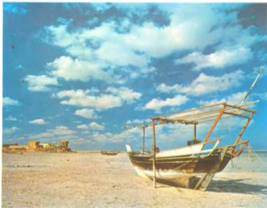
( عتمة لوني كاسل - جلف ناير )