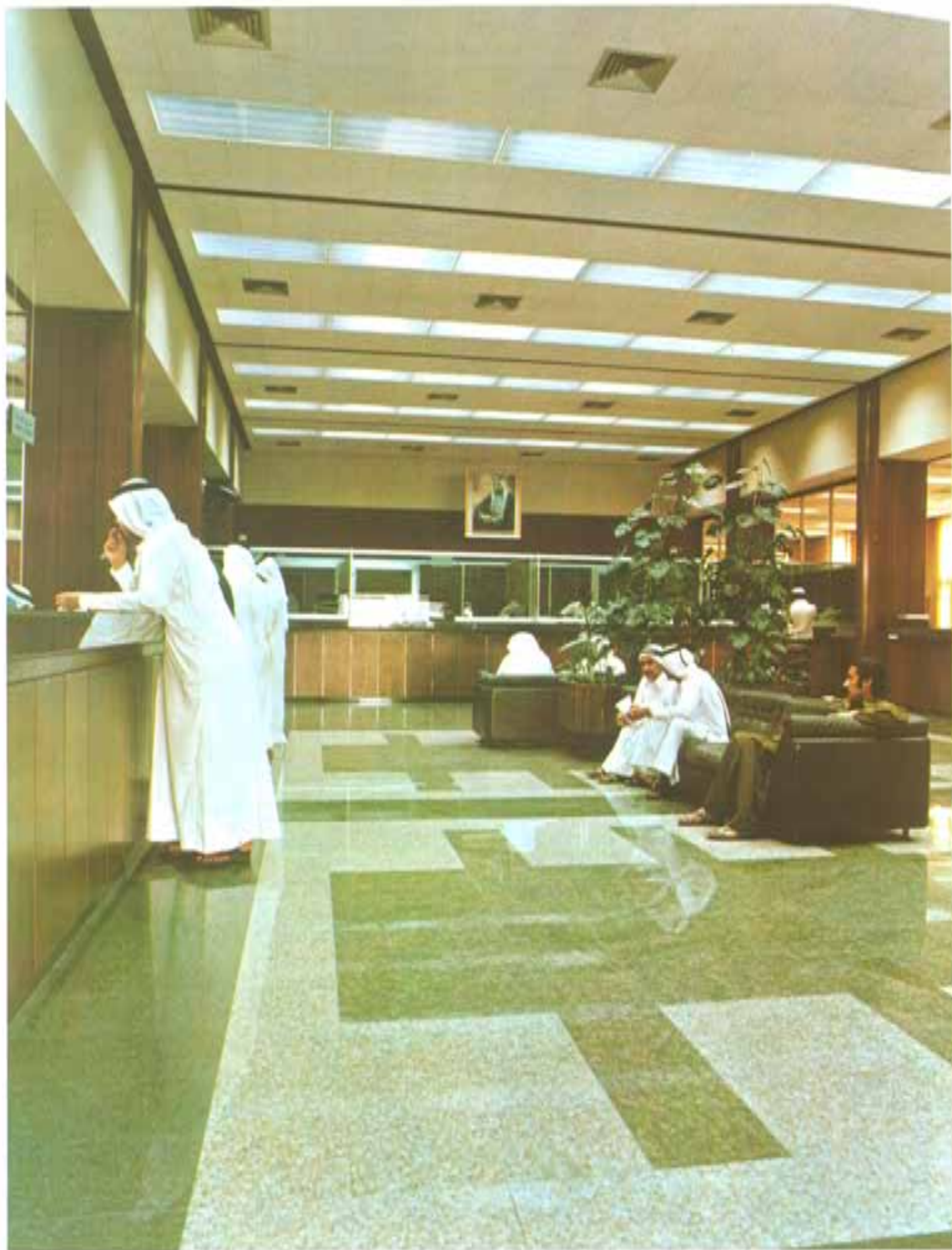
قاعة البنك - الفرع الرئيسي - الدوحة