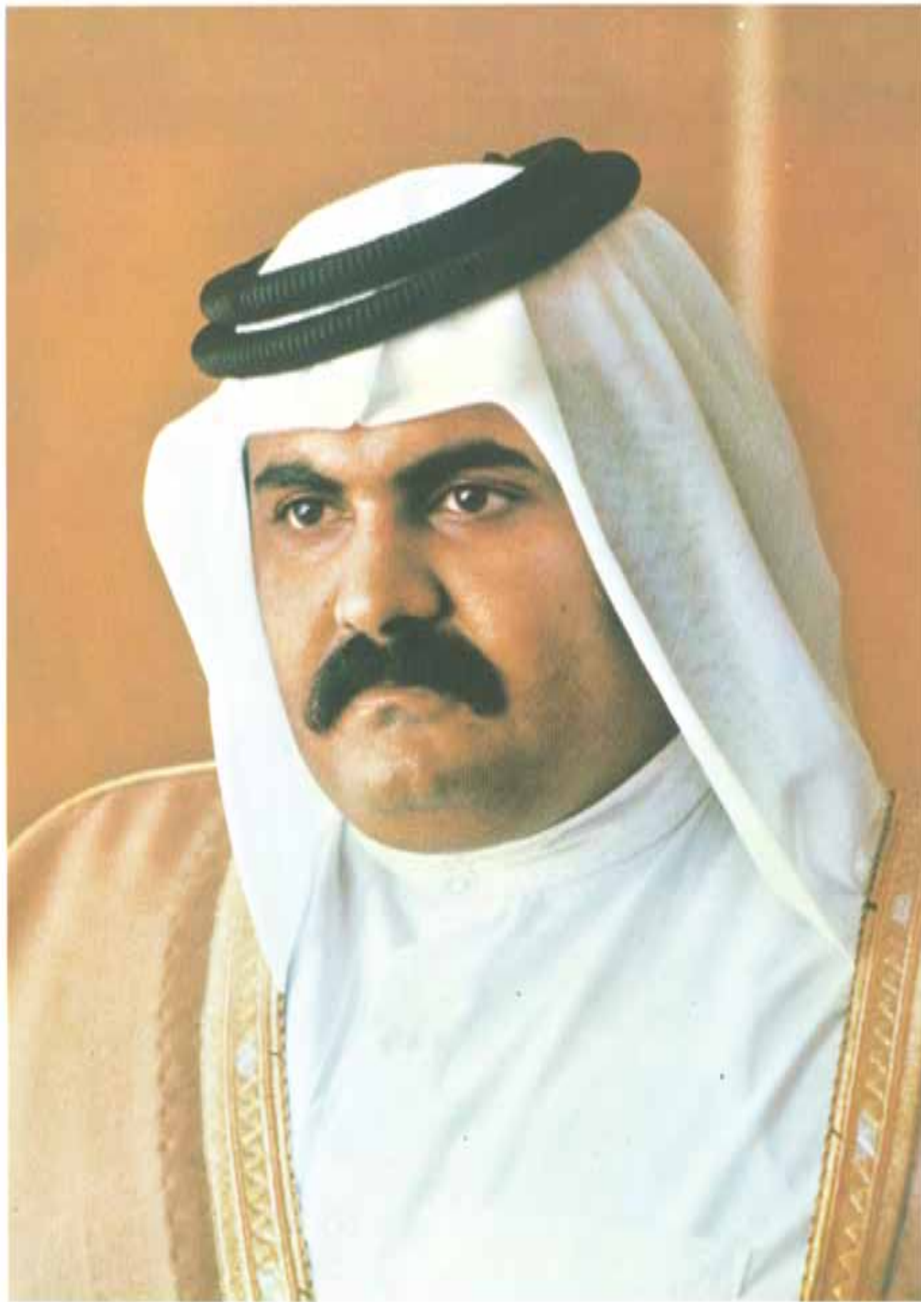
حضرة صاحب السمو الشيخ محمد بن خليفة بن محمد الثاني ولي العهد ووزير الدفاع