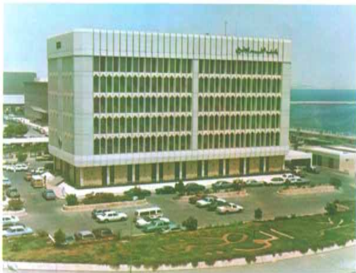
الإدارة العامة والفرع الرئيسي - الدوحة